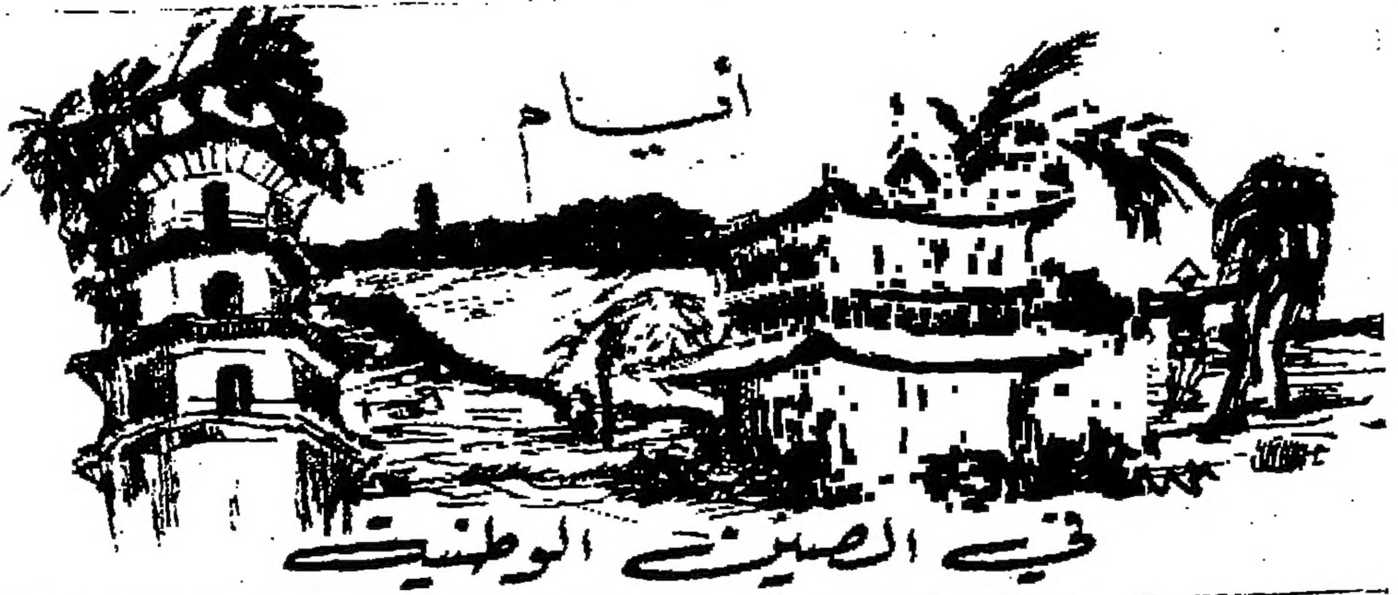
في الصين الوطنية

فتوى حضارة وظلم مهما قطع الانسان من اشواط في الحضارة والرفي ، مهما يتعلم ويتقدم ، ما دام هذا الانسان لم يجرؤ على رفع اليد عن شعبي وازالة العدوان عن امتي ، فالتقدم ليس الا تخرا ، والحضارة والرفي مجرد دهان فقط . مهما ترتفع ناطحات السحاب ، تتحدى الفضاء بكبرياء المتصيرين على الطبيعة ، كل علو ليس الا انطباعا ، وكل كبرياء ذل ، ما دامت السنوات تنطو السنوات واهلي في خيمهم ، تجرد الامل في قلوبهم ، وتخرس الابصار على شفاهم في كآبة مخنوقة . مهما يتعمقون على الموائد ، وينظفون في الولائم ، ما دام هنالك شعب بعيدا عن مانتعتي في بلدته ، محروما من وليمتهم اهله ، فكل سكر مر ، وكل شراب علقم ، سم يتجرعونته وموت يشربون . كل الالكترونيات والانهما تافهة ، كل الاختراعات والاكتشافات لا قيمة لها ، ما دام السدا ياكل من مفتاح بيتي لانتي لم استعمله منذ عشرين سنة . مهما حلقت في الفضاء وهم مقتدون ، مهما تعمقوا في البحر وهم موتقون ، مهما الفواوتكوا وهم ابيون ، مهما قالوا وحكوا وهم سم بكم ، خطوة جريئة واحدة مطلوبة من هذا الانسان قبل ان يدعي الحضارة ، قبل ان ينطق السحاب ، هذه الخطوة على اقصى ضرورة ليرفاح خيبره وهو ياكل ، ليشعر بالهناهة وهو يشرب ، ليستفيد من الاختراعات ويستغل الالكترونيات ، مطلوب منه قبل ان يحلق في الفضاء ويغوص في البحر ، قبل ان يكتب ويقرأ ، مطلوب منه ان يسأل ضميره لماذا هذه الخيبة ، واين كان صاحبها يسكن قبل هذه الالام ، وما هو واجبي لاعيده الى قصره ، لاغسل السدا عن مفتاح بيته . ما دام هنالك من هو محروم من حقوق الانسان ، فكل انسان يجب ان يحرم من جحد الانسانية ، من لذة الشعور بلعجات الحضارة ، لان الحضارة التي تسكت على الظلم هي حضارة سطحية . ابنان - « فتوىجي »